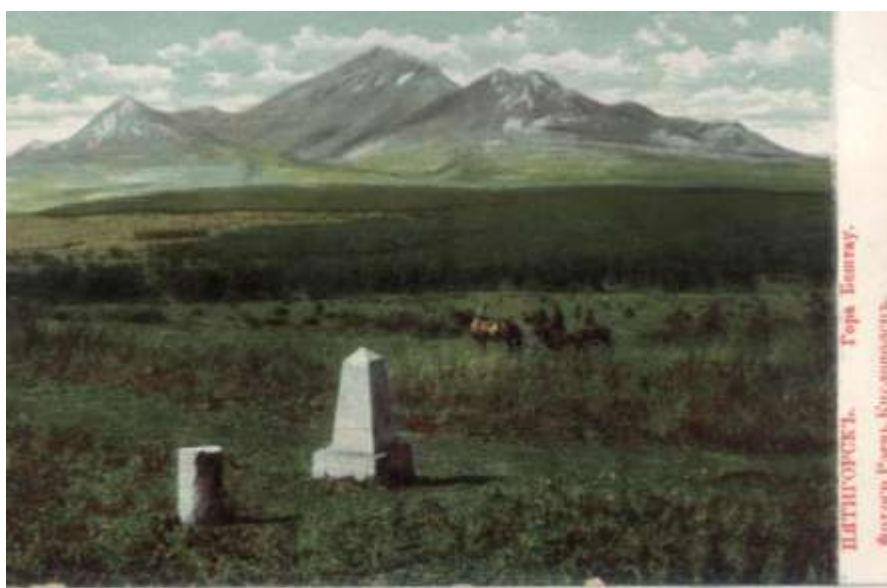
Открытка. Пятигорск. Гора Бештау. ПКМ Нв.Ф. 3356/83

1878 г. 14/26.05. В «Листке» объявлено о временном закрытии доступа в «Провал» из-за угрозы падения камней сверху вследствие ливших на протяжении целого месяца дождей. Кроме того было проведено искусственное ограждение наружного верхнего отверстия Провала. (Большой Провал в Пятигорске..., 1911. - С. 35; Польской Л.Н. Летопись..., 1993. – С. 31).