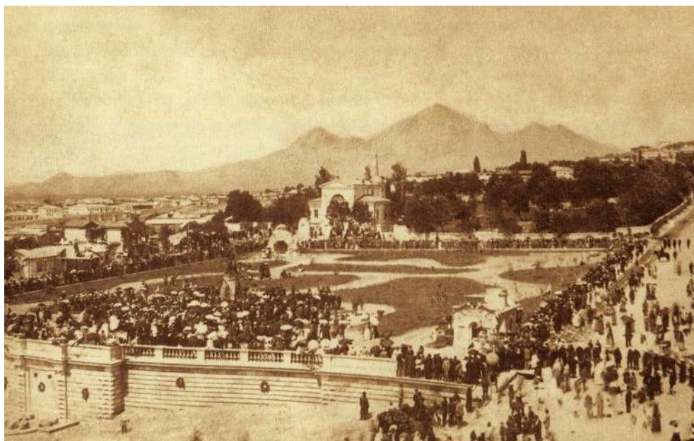
Пятигорск. Торжественное открытие памятника М.Ю. Лермонтову ПКМ О.Ф. 3874/4