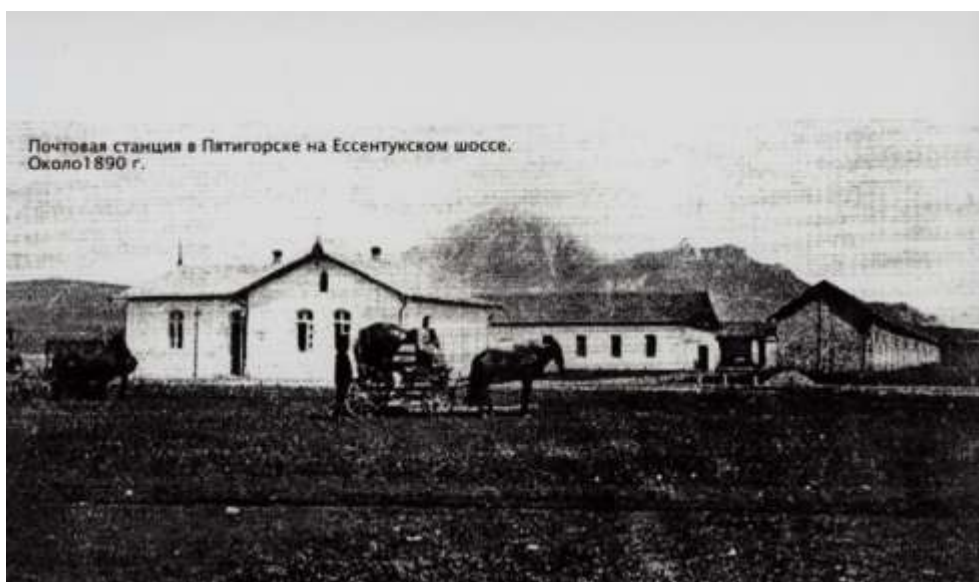
Почтовая станция в Пятигорске (не сохранилась) на Эссентукском шоссе (ныне - ул. Октябрьская). Фото около 1890 г.

(Листок для посетителей..., 1875. 17–15 сентября; Польской Л.Н. Летопись..., 1993. – С. 29).