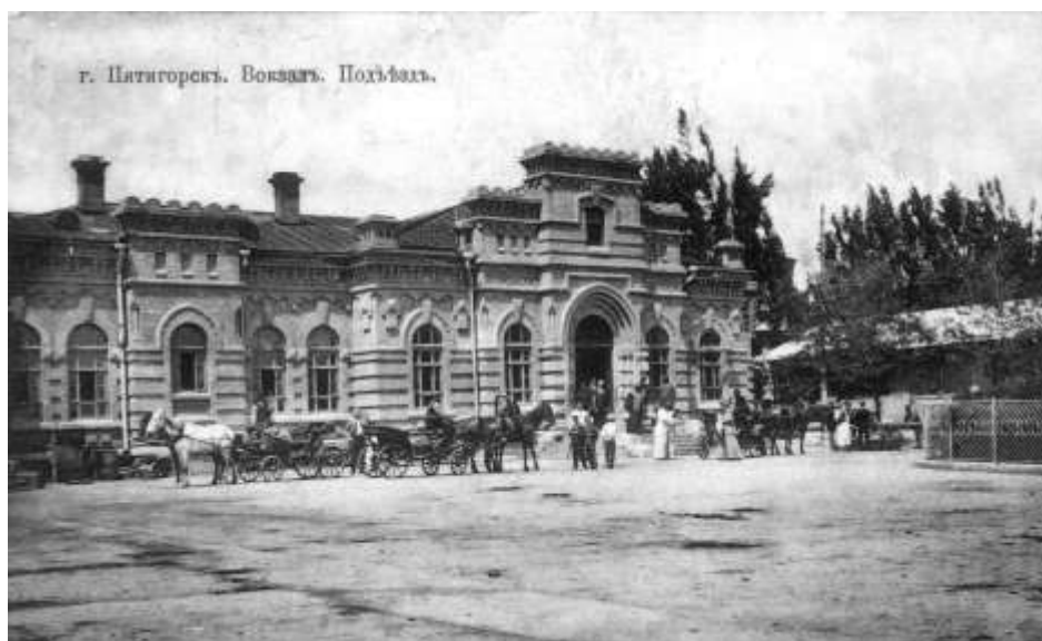
Пятигорск. Вокзал. Подъезд. ПКМ О.Ф. 4758.

1894 г. 17/29.05. Официальное открытие минераловодской ветви Владикавказской железной дороги. Построена по инициативе управляющего Ростово-Владикавказской железной дороги (1880-1908) инженера путей сообщения Ивана Дмитриевича Иноземцева. В честь него названа станция «Иноземцево» (б. Каррас). Минераловодская ветвь прошла от ст. Минеральные Воды до Кисловодска, что сыграло важную роль в развитии всей системы поселений КМВ, в улучшении их транспортного сообщения. В Пятигорске на Ярмарочной площади рядом с храмом был построен городской вокзал. (Кавказский календарь..., 1890. - С. 60; Польской Л.Н. Летопись..., 1993. - С. 37).