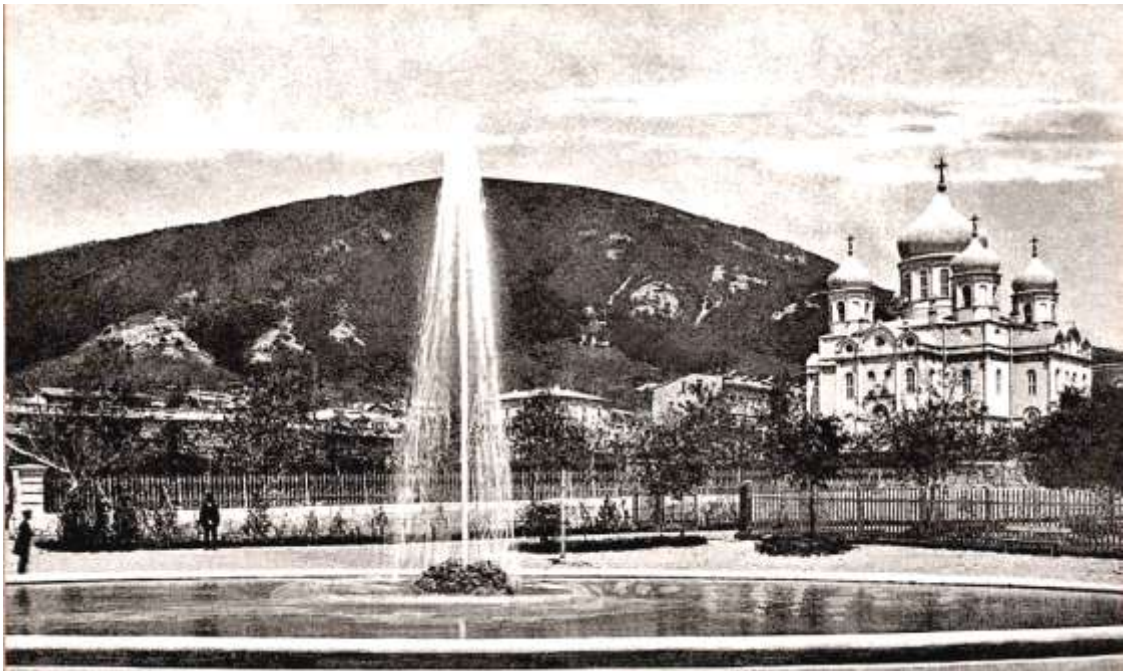
Пятигорск. Фонтан «Великан» в городском сквере. ПКМ Нв.Ф. 6067.