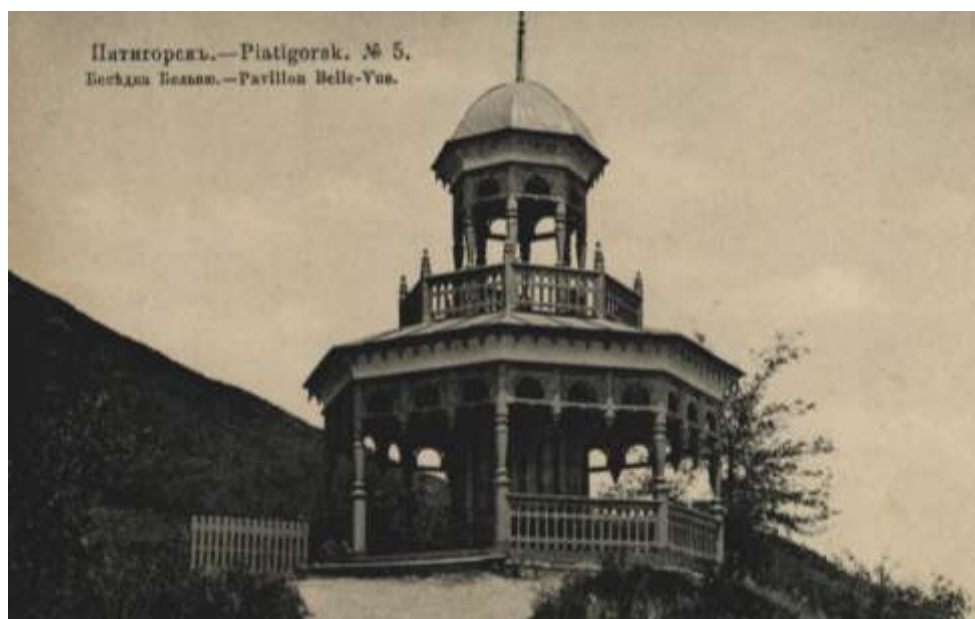
Открытка. Пятигорск. Беседка Бель-вю. ПКМ О.Ф. 17754.

1889 г. Сооружение архитектором КМВ А.М. Кочетовым деревянной с резьбой восьмигранной беседки с бельведером (надстройка) под куполом для обозревания окрестностей. Построена беседка вокруг винтовой железной лестницы от старой деревянной каланчи с флагштоком. Новая беседка получила название Бель-вю (фр. - очаровательный вид). Беседка не сохранилась, остались остатки круглого фундамента на вершине утеса Горячей горы позади Академической галереи. (Боглачев С.В. Архитектура.., 2012. - С. 478).