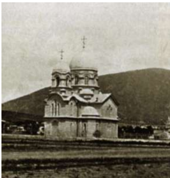
Храм во имя Святого архистратига Божия Михаила на Ярмарочной площади