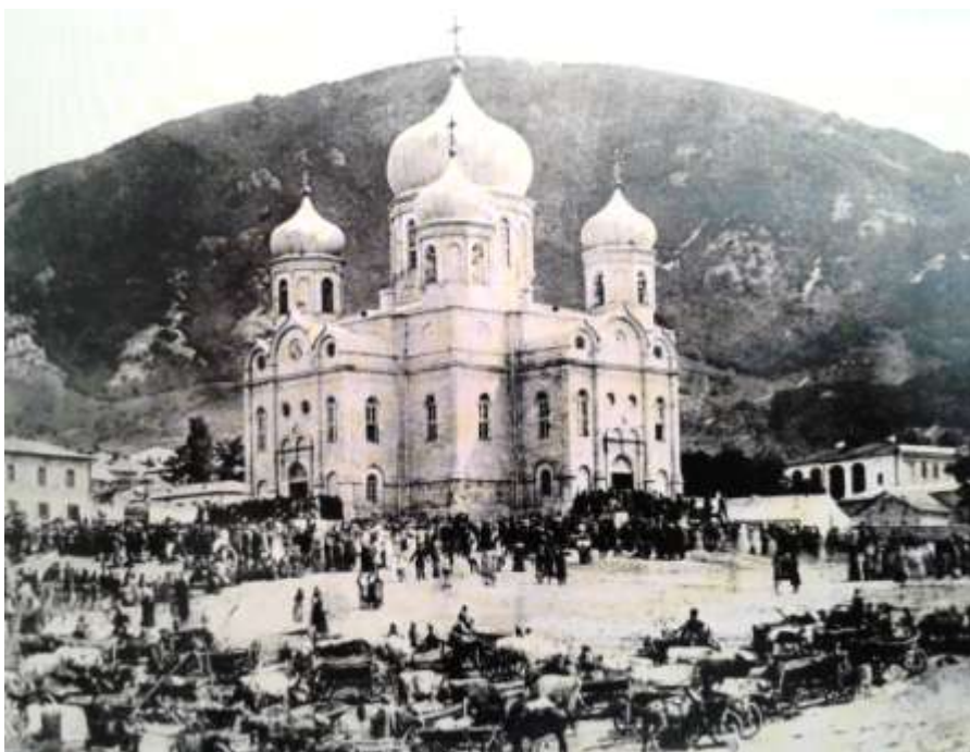
Освящение Соборного храма во имя Христа Спасителя.