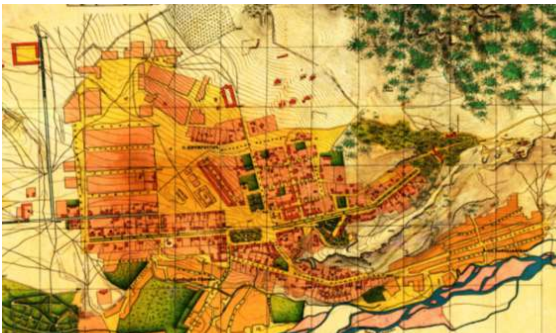
Фрагмент плана Пятигорской группы Кавказских Минеральных Вод 1887 г. ПКМ О.Ф. 1958

1887 - 1888 гг. Начальник Пятигорского окружного полицейского управления - подполковник Стопчанский Александр Михайлович. (Кавказский календарь., 1887. - С. 56; Кавказский календарь., 1888. - С. 183, 184).