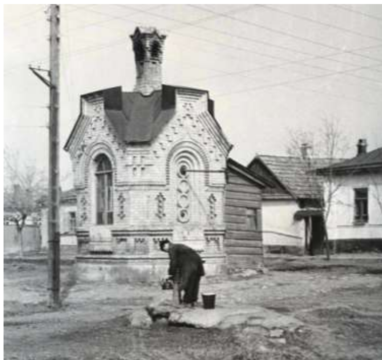
Сохранившаяся водоразборная будка на Кабардинской слободке. Перед ней - построенная позже - колонка для набора воды.